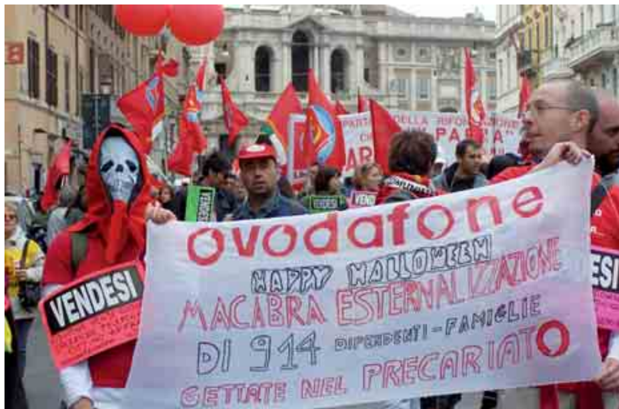
> Lavoratori della Vodafone alla manifestazione nazionale contro il precariato, per il welfare e lo stato sociale